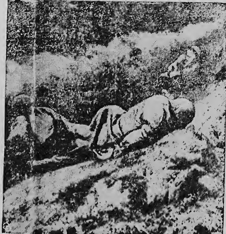
NA JARENLANGE STRIJD is de rust eindelijk weergekeerd aan de Koreaanse fronten. Uitgeputte soldaten kregen deze rust juist na een verwoed slotoffensief der Roden, die kans zagen hun selingen vlak voor het sluiten van het bestand nog te verbeteren.